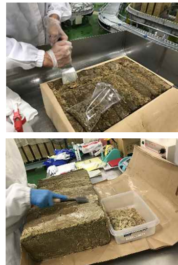
黒糖品質検査の様子