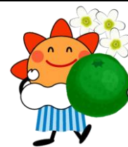
気象庁マスコットキャラクター はれるん