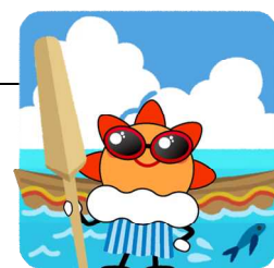
気象庁マスコットキャラクター はれるん