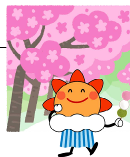
気象庁マスコットキャラクター はれるん