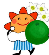
気象庁マスコットキャラクター はれるん