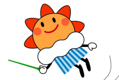
気象庁マスコットキャラクター はれるん