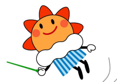
気象庁マスコットキャラクター はれるん