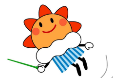
気象庁マスコットキャラクター はれるん