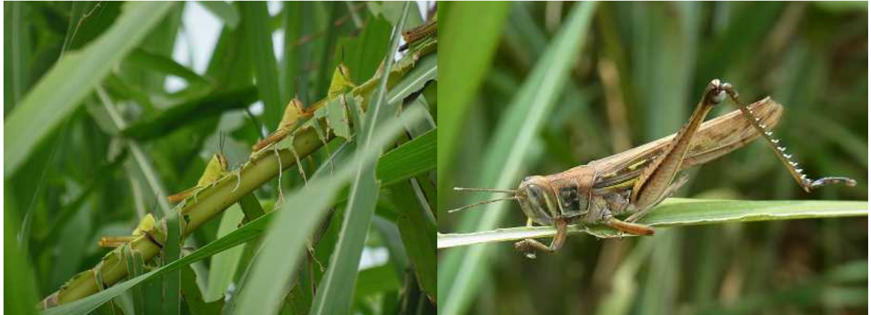
図2 タイワンツチイナゴの幼虫(左)と成虫(右)