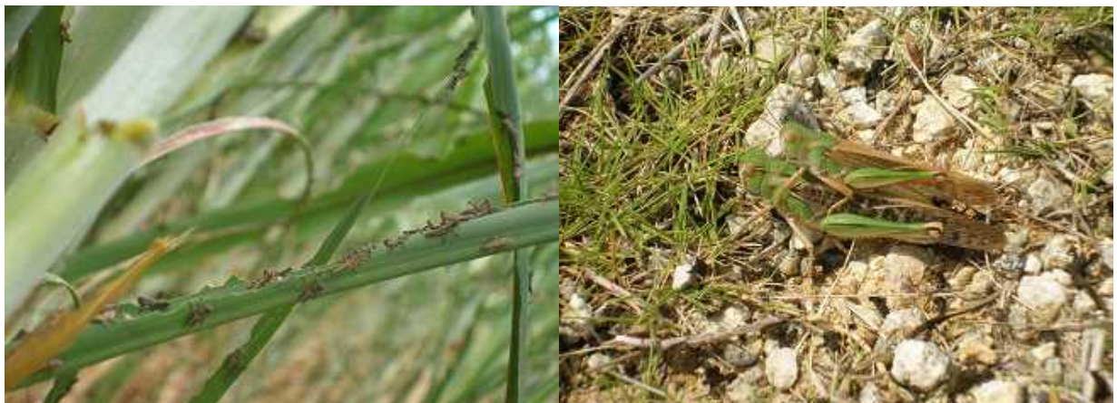
図4 トノサマバッタの幼虫(左)と成虫(右)

★詳しくは沖縄県病害虫防除技術センターにお問い合わせ下さい★ TEL : (本所)098-886-3880、(宮古駐在)0980-73-2634、(八重山駐在)0908-82-4933 ホームページアドレス : http://www.pref.okinawa.jp/site/norin/byogaichuboj/index.html