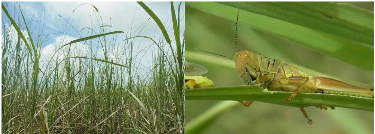
図3 ヒゲマダライナゴの被害(左)と成虫(右)